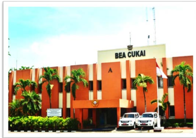
Gambar 4.1: KPUBC Tipe C Soekarno Hatta Gedung A