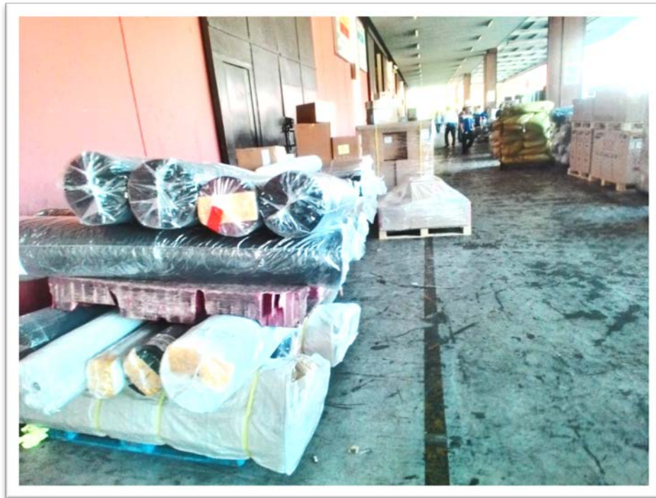
Gambar 4.7: Laporan Harian Penerimaan Gudang