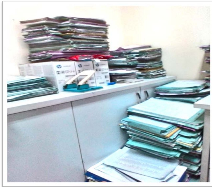
Gambar 4.5 : Input data untuk mengetahui jumlah waktu pemeriksaan dokumen