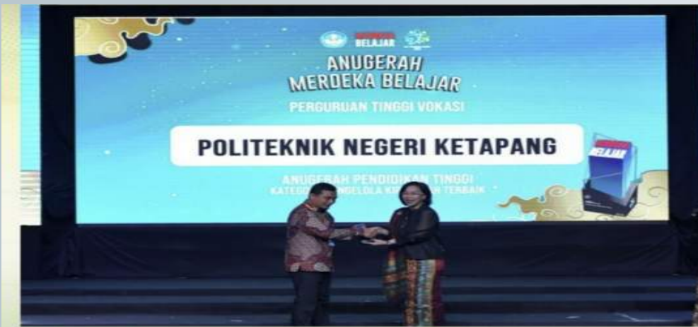
POLITEKNIK NEGERI KETAPANG MERAHAI PENGHARGAAN ANUGRAH MERDEKA BELAJAR TAHUN 2023 KATEGORI PENDIDIKAN TINGGI VOKASI, SUBKATEGORI PENGELOLA KARTU INDONESIA PINTAR (KIP) KULIAH TERBAIK 1 (29/5/2023)