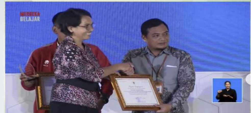
POLITEKNIK NEGERI KETAPANG MENERIMA PENGHARGAAN (TERBAIK KEDUA) DALAM KATEGORI PERGURUAN TINGGI DENGAN POLA PENGELOLAAN KEUANGAN NEGARA PADA UMUMNYA OLEH MENDIKBUDRISTEK (30/3/2023)