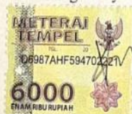
Vivi Nurhidayah Indraswari