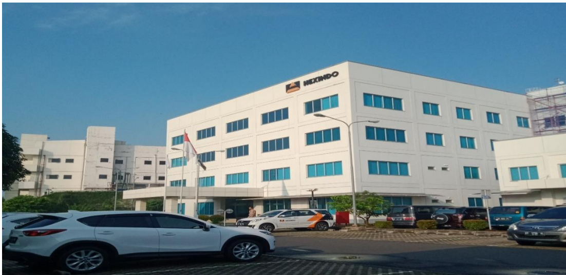
Gambar II : Kantor Pusat PT Hexindo Adiperkasa Tbk

PT Hexindo Adiperkasa Tbk didirikan di Indonesia berdasarkan Akta Notaris Mohamad Ali,S.H., No. 37 tanggal 28 November 1988. Perusahaan memulai operasi komersial pada bulan Januari 1989.