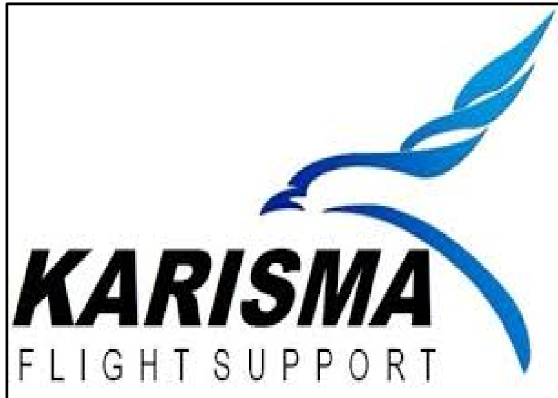
Gambar 3.1 : Logo PT. Karisma Flight Support