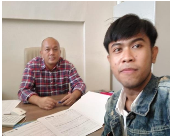
Gambar 12 : Foto Bersama Calon Debitur dan Survei kantor