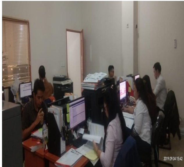
Gambar 11 : Ruang Admin analis