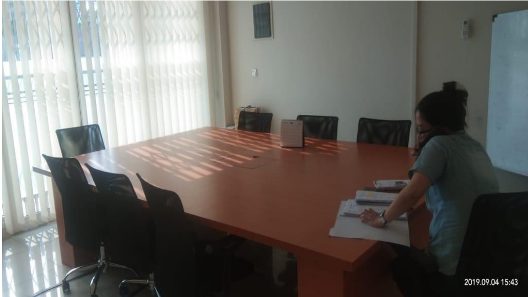
Gambar 9 : Ruangan Meeting Marketing