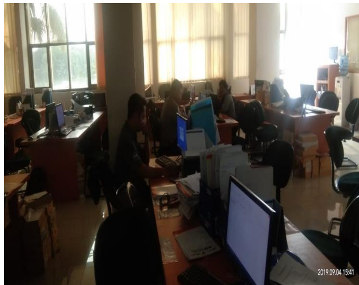
Gambar 10 : Ruang Magang