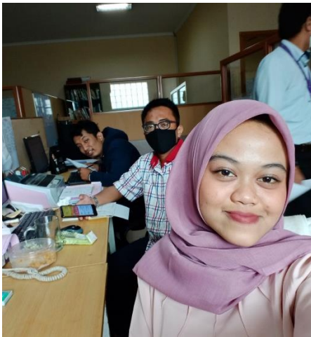
Bersama Staff bagian Purchasing