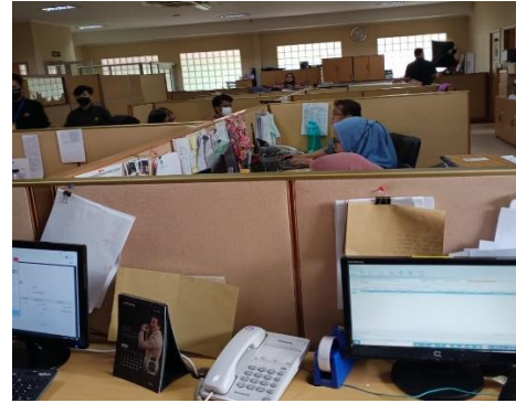
Suasana di dalam kantor PT Cultureroyle Indonesia.