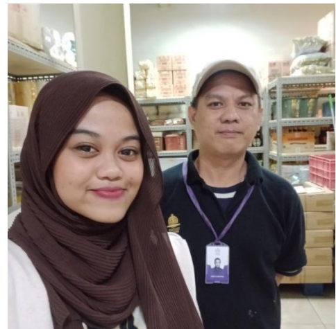
Bersama Staff bagian Store