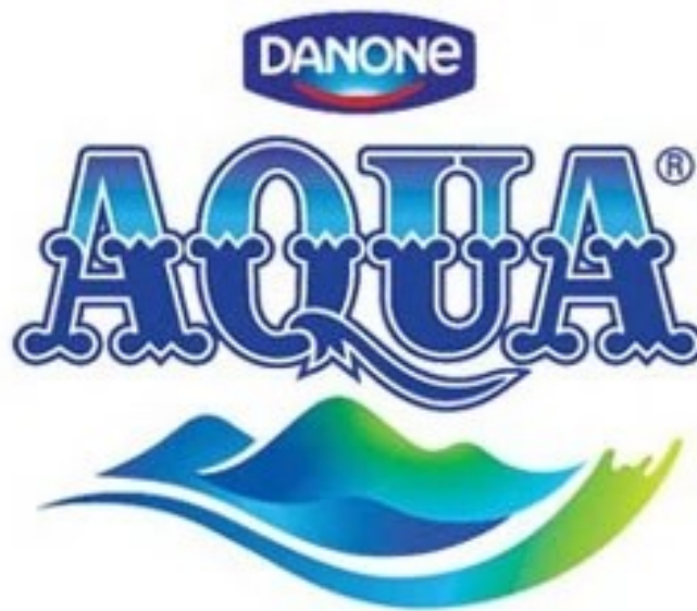
Gambar 3.1 : Logo produk PT. Tirta Investama

pendistribusian produk hanya di Jakarta, Tangerang, Bekasi, karena pembagian wilayah dengan DC Rawa Domba.