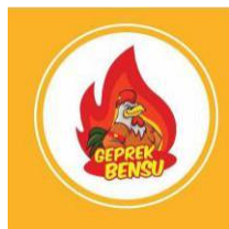
Gambar 4.1. Logo Brand Image Ayam Geprek Benu

Gerai pertama Geprek Benu dibuka di kawasan Pademangan, Jakarta Utara pada bulan Maret 2017, gerak ini hanya 36 cukup menampung bahan baku dan karyawan sebanyak 5 orang. Berikut ini adalah logo brand image produk Ayam Geprek Benu seperti yang disajikan pada Gambar 4.1. di bawah ini.