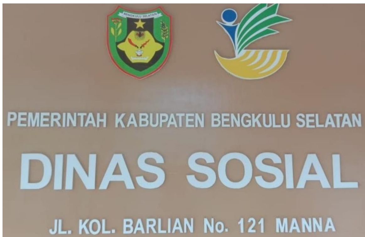
Lampiran 3: Gambar Dinas Sosial