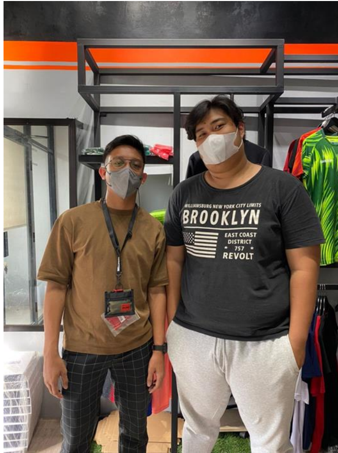
Gambar 4.1 Penulis Dengan Kepala Scheduling Production