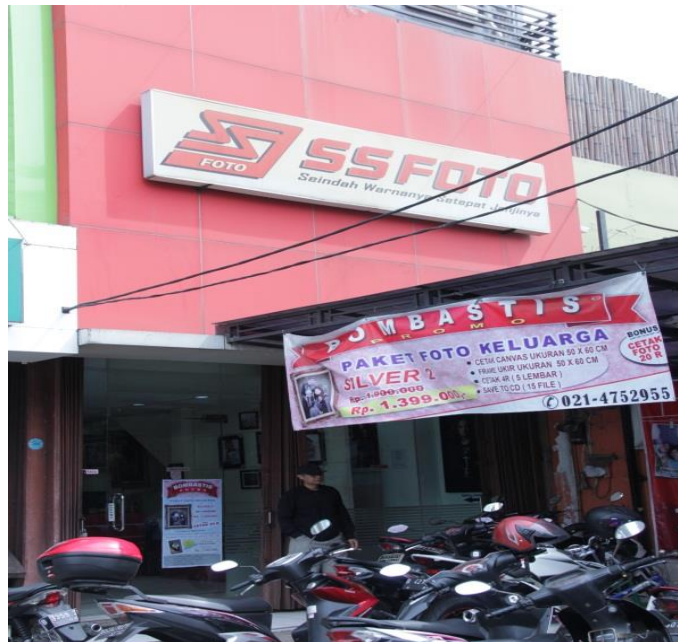
Gambar 3.1 : SS Foto Rawamangun