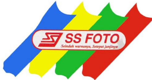
Logo SS Foto