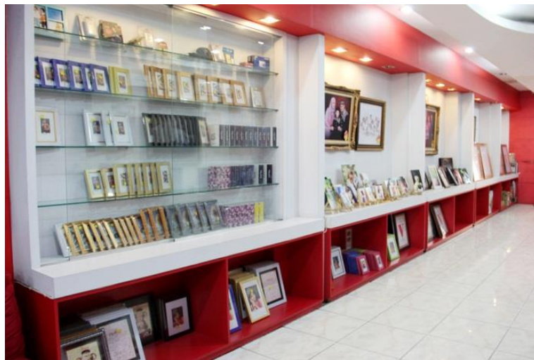
Gambar 3.3 Merchandise SS Foto Rawamangun

Selain jasa fotografi, SS Foto juga mengadakan persediaan barang dagang. Persediaan barang dagang ini untuk menunjang konsumen yang hendak mencetak foto sekaligus membeli merchandise. Persediaan barang dagang yang terdapat pada SS Foto Rawamangun merupakan persediaan barang yang berasal dari pasokan gudang pusat setiap minggunya.