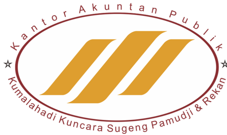
Gambar 3.1 Logo KAP KKSP