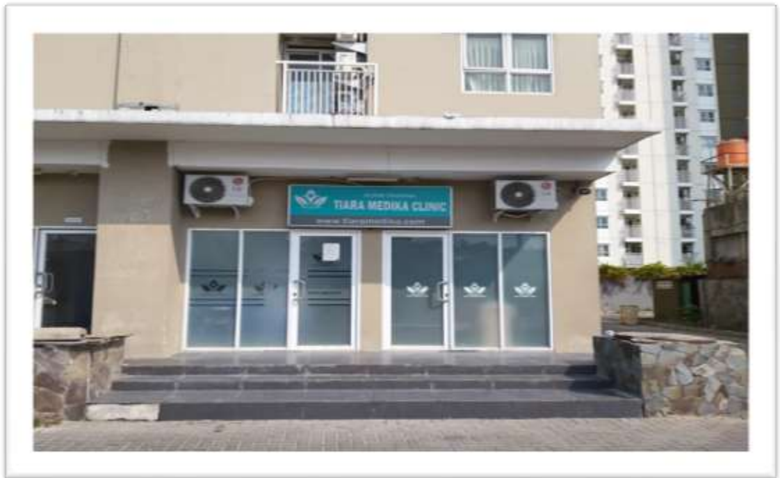
Gambar 2. Klinik Utama Tiara Medika

Klinik Utama Tiara Medika sudah memenuhi sertifikasi ISO 9001:2015 sebagai Penyedia Pelayanan Kesehatan termasuk di dalamnya Medical Check Up , Laboratorium , In house Clinic , Farmasi , Homecare , dan lainnya. Sertifikasi ini dikeluarkan oleh JAZ-ANZ ( Joint Accreditation System of Australia & New Zealand ).