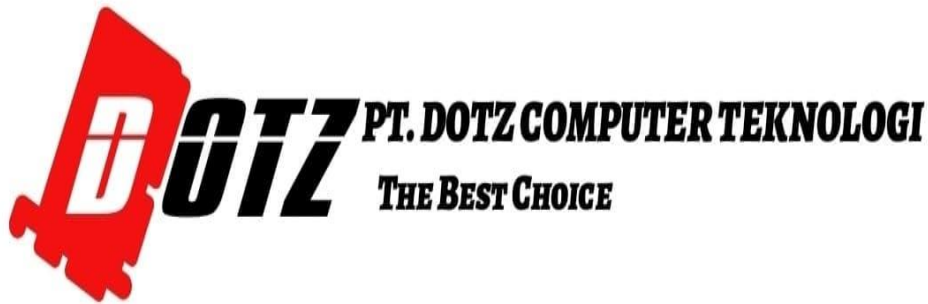
Gambar 3. 1 : Logo PT. Dotz Computer Teknologi.

PT. Dotz Computer Teknologi merupakan perusahaan yang bergerak di bidang jasa perbaikan dan pemeliharaan laptop dan pc komputer. Perusahaan ini baru berdiri pada tahun 2022 yang akan terus mengembangkan sayapnya terutama di bidang jasa perbaikan dan pemeliharaan laptop dan pc komputer.