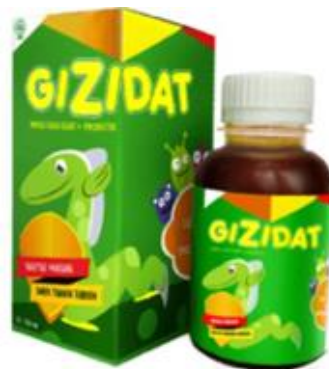
Gambar 3.5 Gizidat