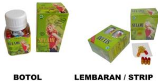
Gambar 3.8 Sulami Herbal