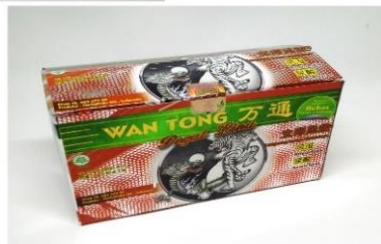
Gambar 3.3 Jamu Wantong