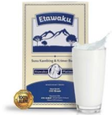
Gambar 3.6 Susu Etawa