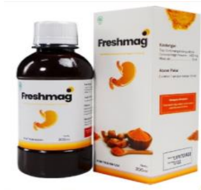
Gambar 3.4 Madu freshmag