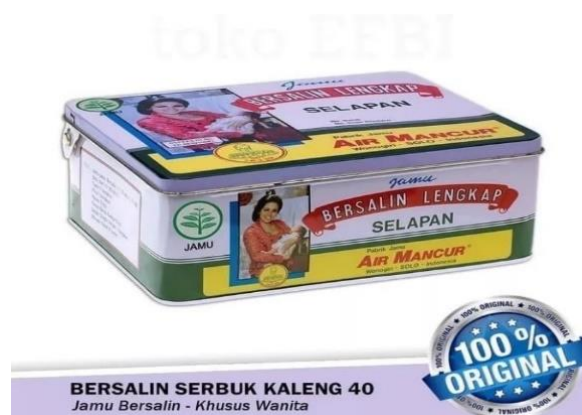
Gambar 3.9 Jamu Bersalin