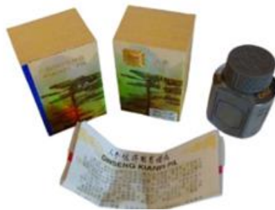
Gambar 3.7 Ginseng Kianpi