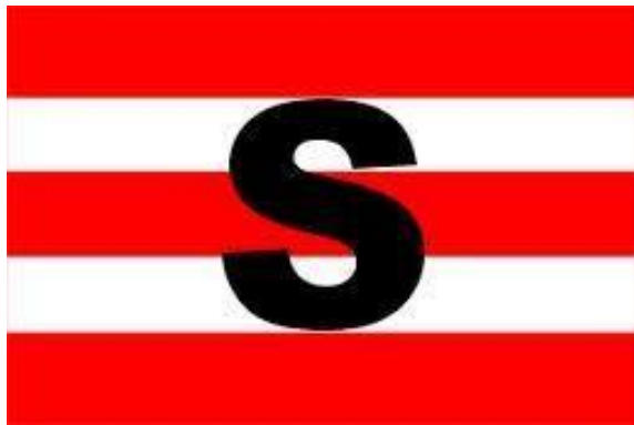
Gambar 1 Logo PT. Prima Nur Panurjwan