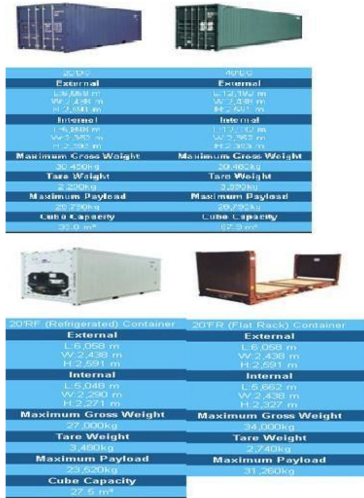
Gambar 4. tipe dan spesifikasi Kontainer