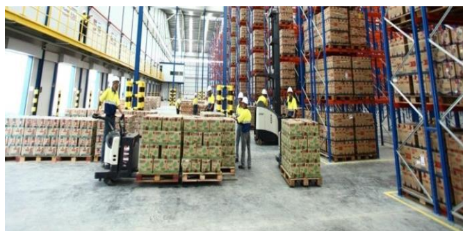
Gambar 5. Contoh gudang Kamadjaja Logistics

Gudang penyimpanan yang menangani berbagai jenis produk dengan penanganan khusus kondisi seperti freezer untuk menyimpan produk beku dan kelembaban lingkungan.