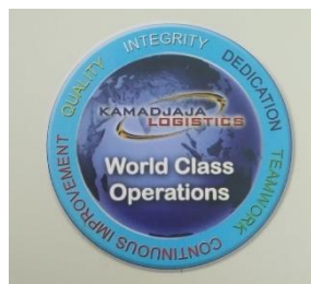
Gambar 2. Core Value Kamadjaja Logistics

Di dalam PT Kamadjaja Logistics memiliki istilah nilai lebih atau biasa disebut Core Value yang didalamnya terdiri dari lima arti .